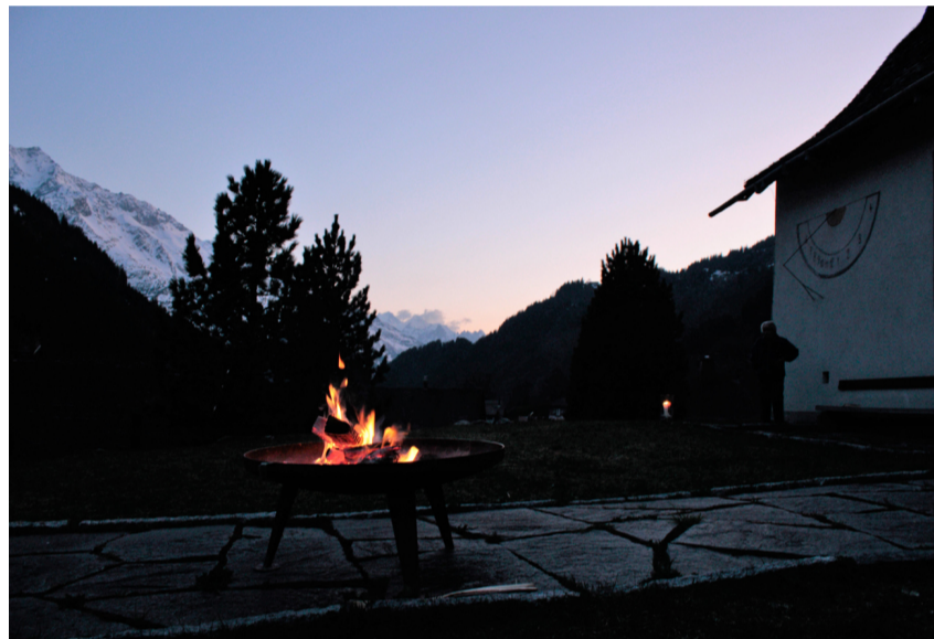
Osterfeuer vor der Kirche Gadmen

Wir treffen uns um 8 Uhr zur Frühfeier in Innertkirchen. Wer lieber die gewohnte Gottesdienstzeit wählt, ist um 10 Uhr zum Festgottesdienst mit Feier des Abendmahls in Guttannen und Gadmen eingeladen.