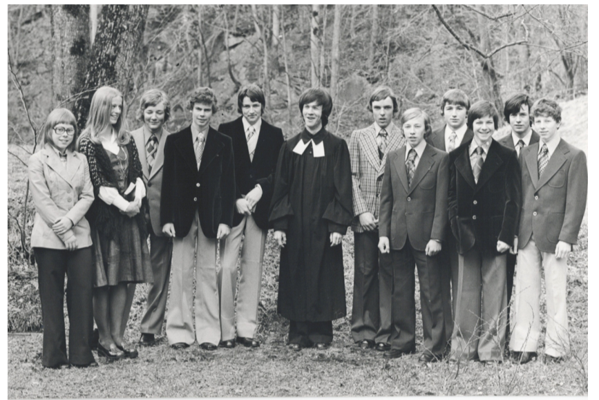
Konfirmation vor 50 Jahren in Innertkirchen. Wer erkennt die Jugendlichen von damals?